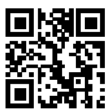
Ersatzhaltestelle Richtung Zoologischer Garten

Verlassen Sie den Bahnsteig in Richtung Ausgang Europaplatz und begeben Sie sich an die Invalidenstraße. Halten Sie sich rechts und folgen dem Straßenverlauf bis zur jeweiligen Ersatzhaltestelle.